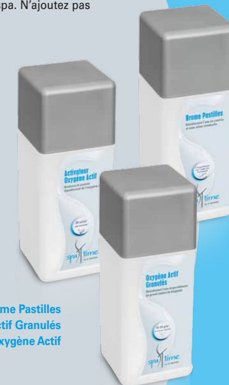
Brome Pastilles Oxygène Actif Granulés Activateur Oxygène Actif

Important : Pour optimiser l'efficacité des granulés, vous devez utiliser en plus l' Activateur Oxygène Actif .