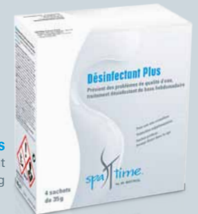
Désinfectant Plus boîte contenant 4 sachets de 35 g

Ce produit est compatible avec toutes les méthodes d'entretien (au chlore ou sans chlore tel que l'oxygène actif ou le brome).